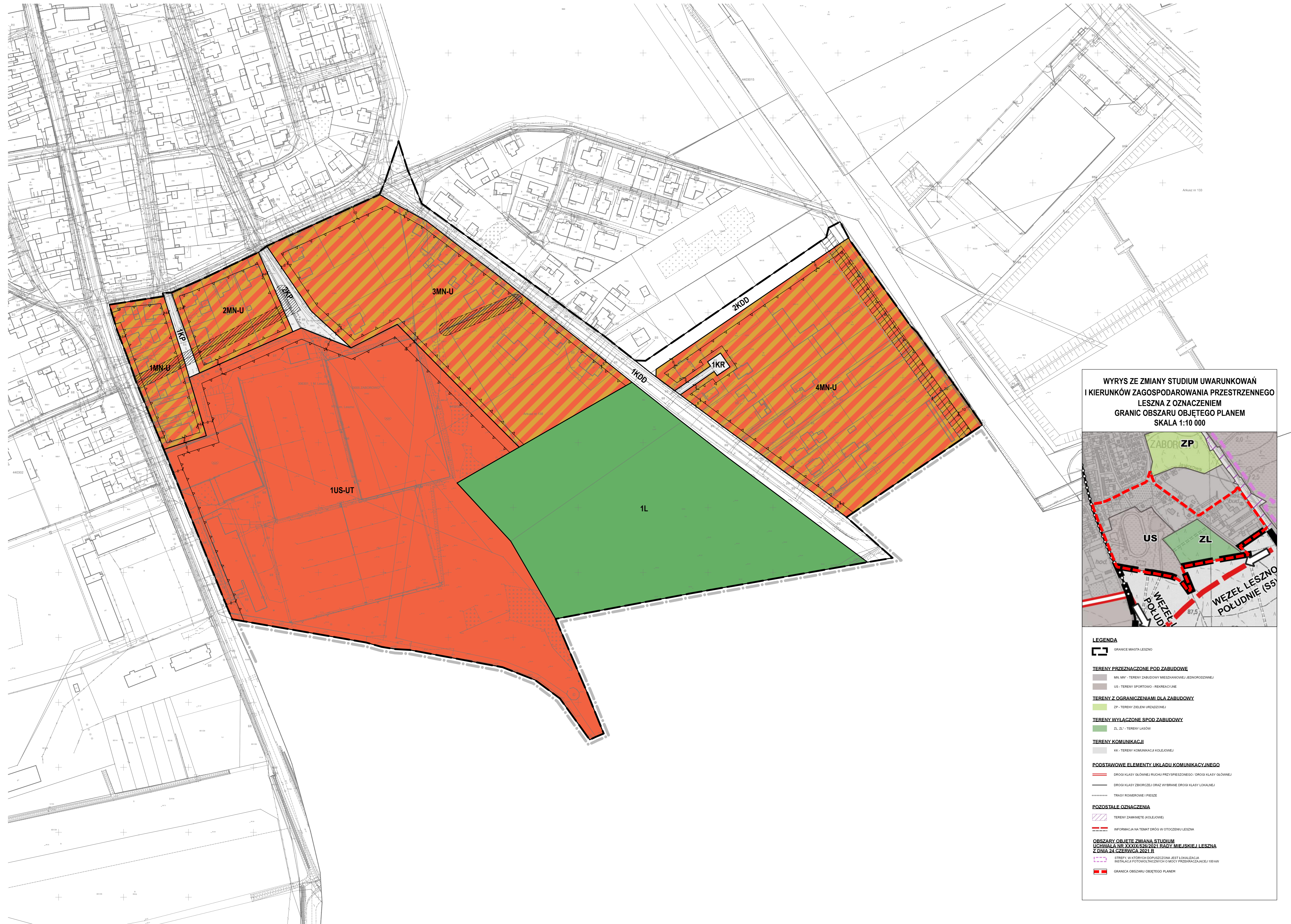
WYRYS ZE ZMIANY STUDIUM UWARUNKOWAŃ I KIERUNKÓW ZAGOSPODAROWANIA PRZESTRZENNEGO LESZNA Z OZNACZENIEM GRANIC OBSZARU OBJĘTEGO PLANEM SKALA 1:10 000

UKŁAD WSPÓŁRZĘDNYCH: PUWG 2000 STREFA 6 MAPA ZASADNICZA POZYSKANA Z PAŃSTWOWEGO ZASOBU GEOCZYNIENIA I KARTOGRAFICZNEGO Licencja nr GD.6642.612.2023.3063.P