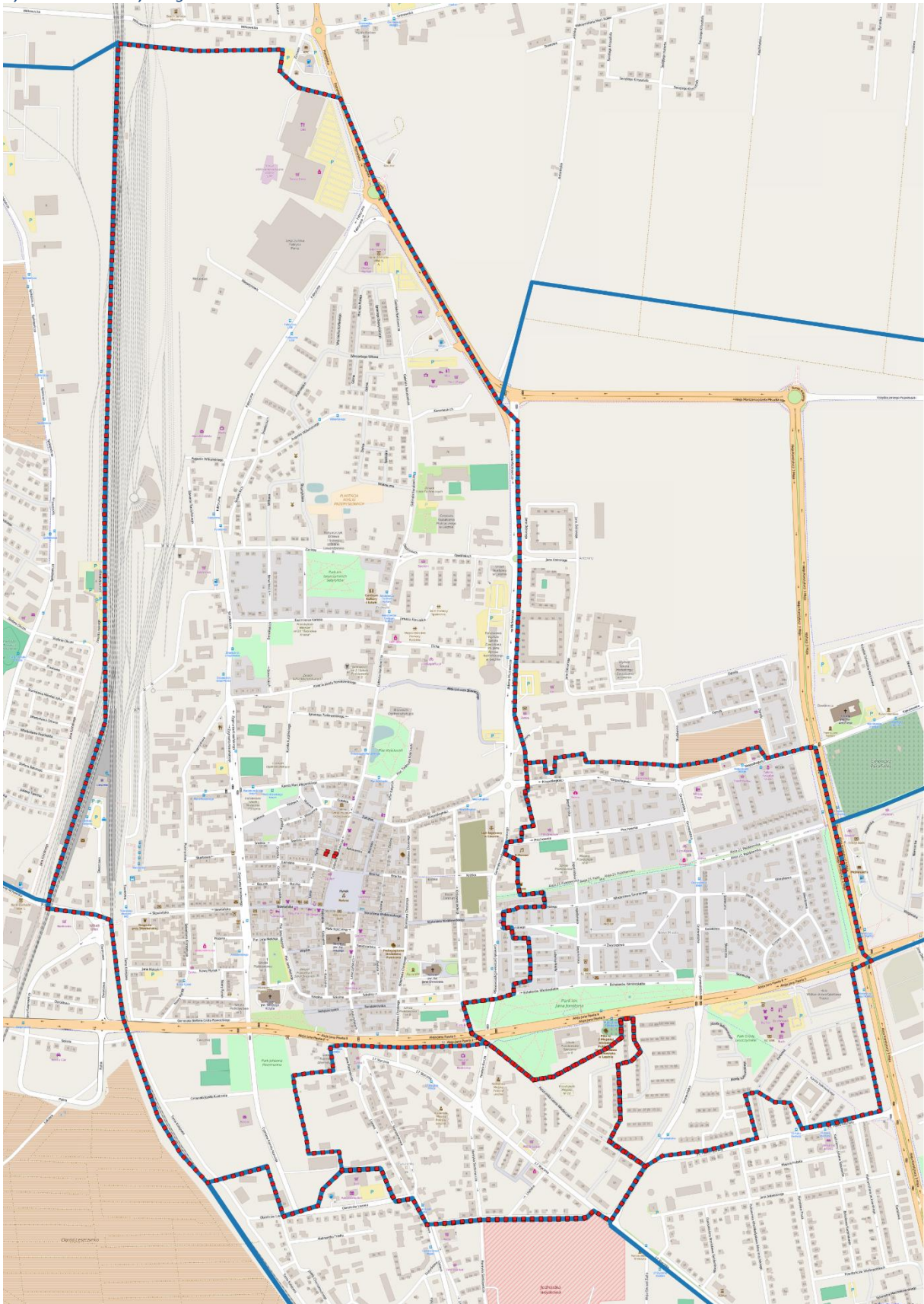
Rysunek 2. Obszary zdegradowane.