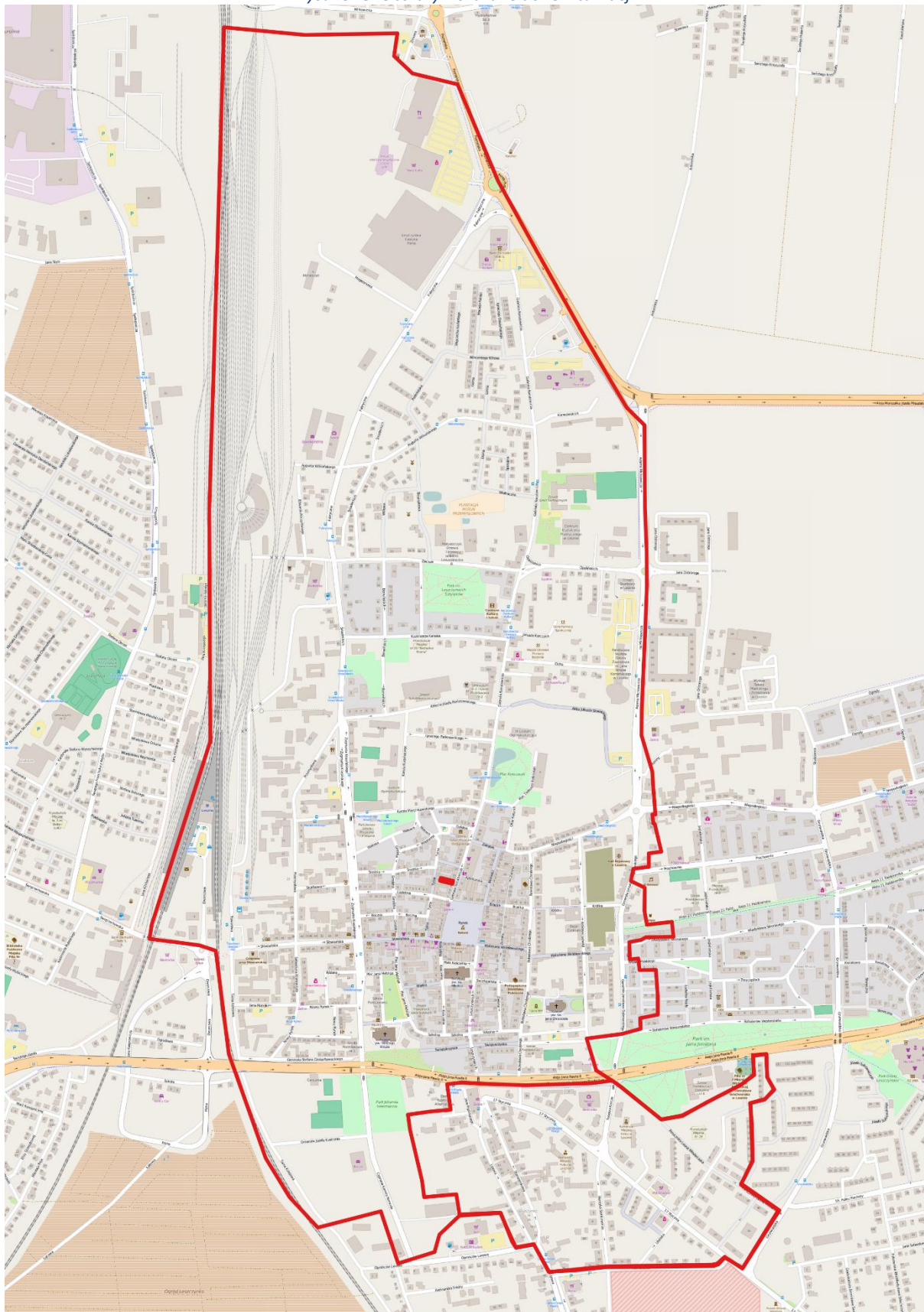
Rysunek 3. Obszary wskazane do rewitalizacji.