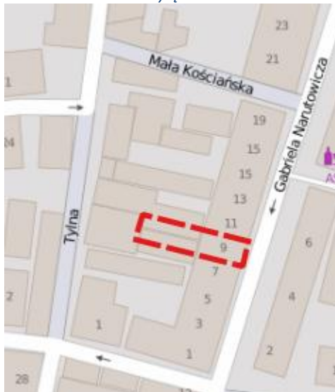
Rysunek 4. Nieruchomość wyłączona z obszaru rewitalizacji.

Źródło: opracowanie własne na podstawie danych dostępnych na licencji Open Database License (OpenStreetMap).