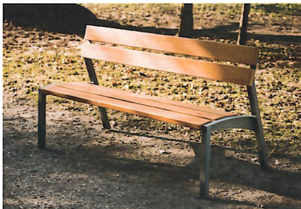
przykładowe zdjęcie ławki lub odpowiednik

Na projektowanym terenie przewidziano montaż 4 ławek - ich rozmieszczenie przedstawiono na planie sytuacyjnym.