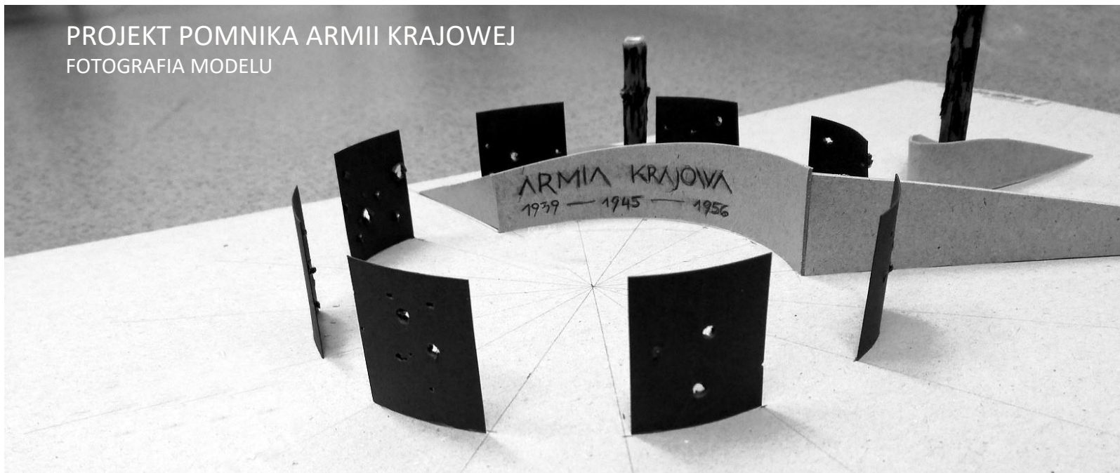
PROJEKT POMNIKA ARMII KRAJOWEJ FOTOGRAFIA MODELU