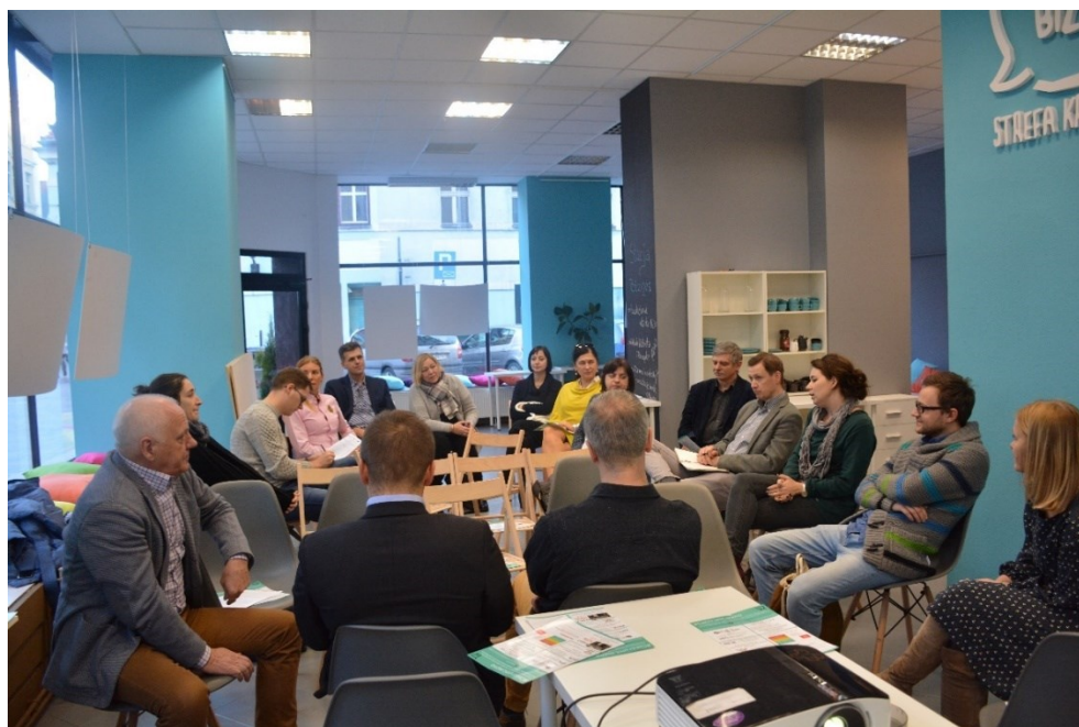
Leszno, styczeń 2017 r.