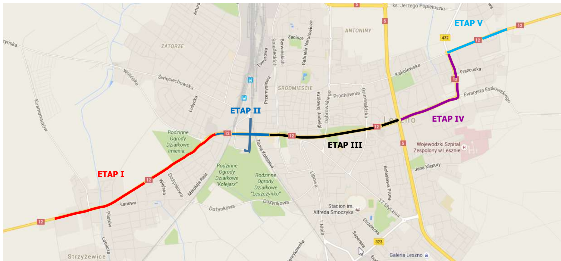
Rysunek: Przebieg drogi krajowej nr 12 w Leszni – podział na etapy