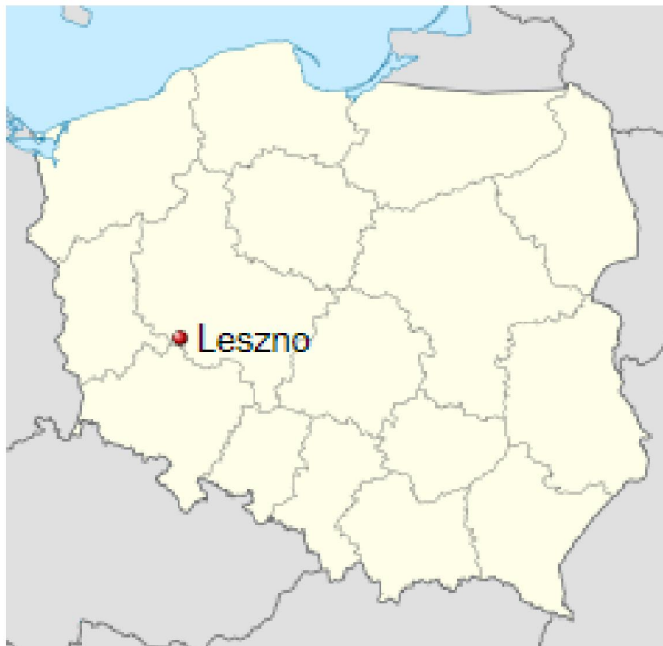
Fot. 1. Lokalizacja przedsięwzięcia na mapie Polski.

Obszar prac objętych przedmiotowym zamówieniem, zlokalizowany jest na terenie województwa wielkopolskiego, powiat leszczyński, Miasto Leszno. Inwestycja zlokalizowana jest na ul. Fabrycznej w m. Leszno. Sygnalizację świetlną należy zaprojektować i wykonać na skrzyżowaniu ul. Fabrycznej z ul. Zacisze oraz na skrzyżowaniu ul. Fabrycznej z ul. Augusta Wilkońskiego. Należy dokonać także koordynacji tej sygnalizacji świetlnej z poprzedzającą sygnalizacją świetlną (od strony centrum).