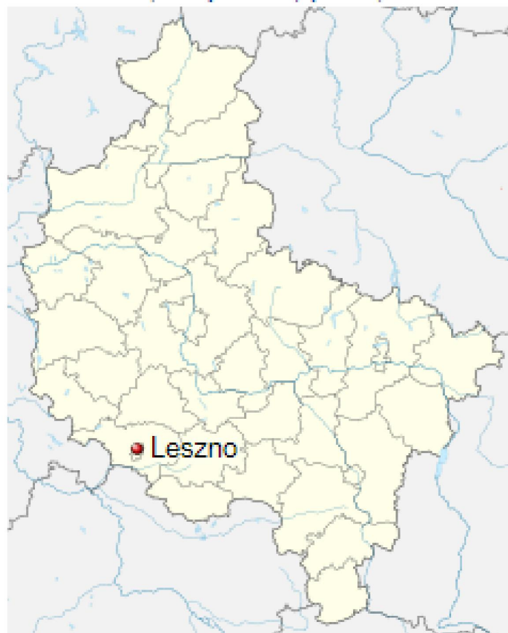
Fot. 2. Lokalizacja przedsięwzięcia na mapie województwa.