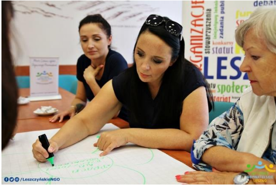
Zdjęcie 3 Kolaż zdjęć ze spotkania roboczego

Raport z przeprowadzenia konsultacji społecznych dotyczących przygotowania Rocznej Programu Współpracy na rok 2020